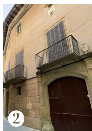
2 CASA CAN CORTADA