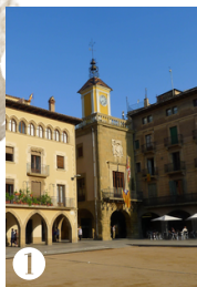
1 AJUNTAMENT DE VIC

El mapa que hi ha a continuació és la guia que us ajudarà a realitzar la ruta guiada. Les diferents localitzacions assenyalades, juntament amb els codis QR, us permetran endinsar-vos en les històries dels vigatans exiliats, les circumstàncies i les vivències viscudes per cada una de les víctimes.