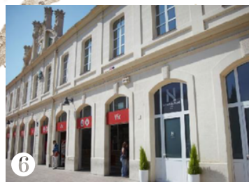
6 L'ESTACIÓ DE TREN