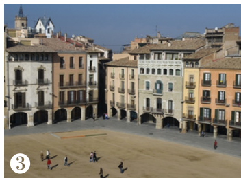
3 PLAÇA MAJOR