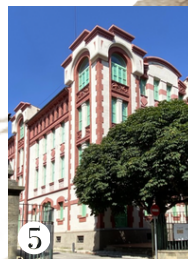
5 LA FARINERA