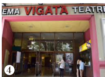
4 TEATRE VIGATÀ